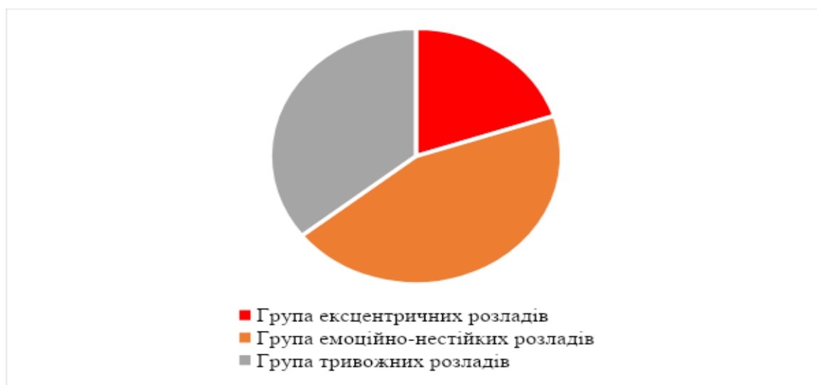
Рис. 2. Аналіз результатів схильності респондентів до ПРО

Визначення схильності людини до певного психічного розладу реалізовувалось шляхом онлайн-тестування («A test for...»), де отримані результати засвідчили наявність у респондентів симптомів ПРО, що розподілились за трьома групами, а саме ексцентричні розлади (ЕР), емоційно-нестійкі розлади (ЕНР) та тривожні розлади (ТР). Результати опитування зазначені на Рисунку 2.