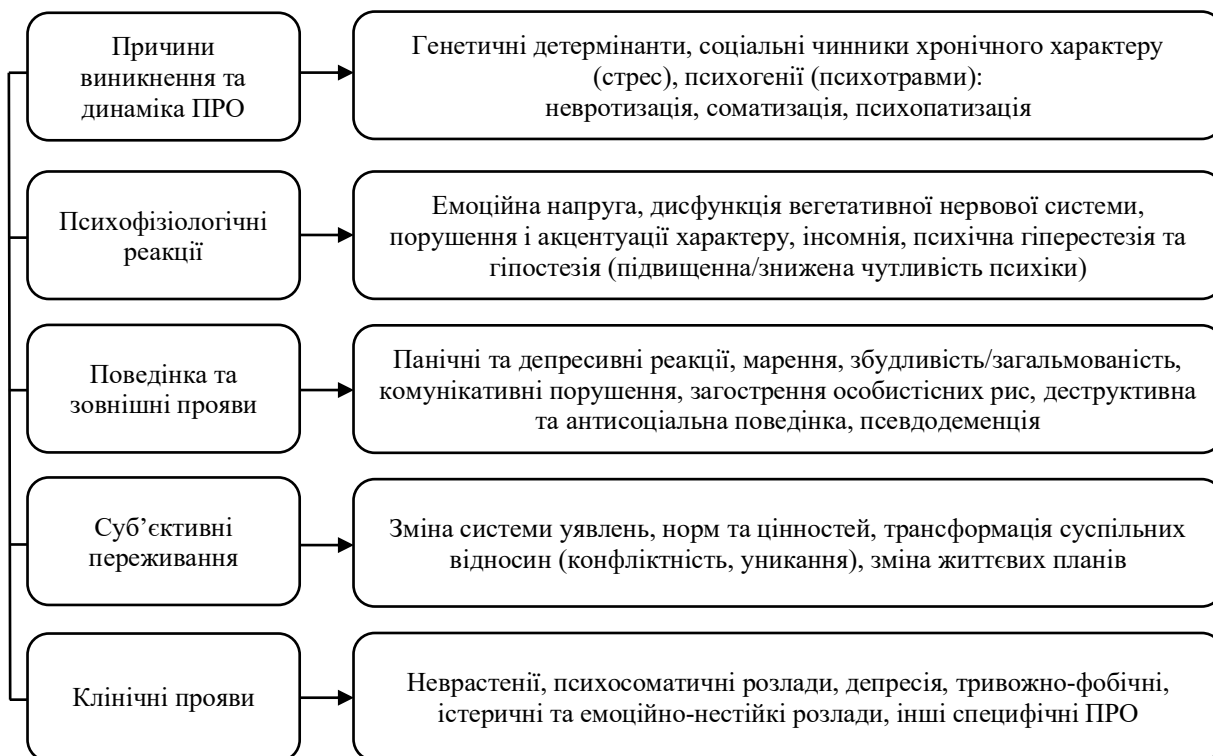
Рис. 1. Особливості прояву психічних розладів особистості

Проаналізовані наукові надбання дослідників (Bockelyuk and Panov, 2021; Onishchenko and Kazakova, 2021; Rossi et al., 2020; Okorn et al., 2020; Choi-Kain et al., 2022; Chen and Lucock, 2022; Georgieva et al., 2021; Hoffart et al., 2022), які вивчали вплив пандемії COVID-19 та його наслідків на психічне здоров'я населення, вказують на посилення симптомів, що притаманні особистісним психічним розладам. Зокрема зміни в емоційному стані через запобіжні заходи (ізоляція), нестабільність внутрішніх переконань, економічного та соціального життя можуть спричинювати психоз, що буде проявлятися симптомами депресії, патологічних афектів, тривожності, аномальністю в переживаннях (галюцинації, безсоння). Також автори вказують на розвиток параноїдальних переконань, що пов'язані зі страхами про власне здоров'я та відсутністю можливості вплинути на ситуацію. Окрім цього людині зі схильністю до психічного розладу важко залишатись гнучкою у поведінкових реакціях на травматичну подію, що збільшує її конфліктність та створює помітні розбіжності у взаємодії з оточенням. Більш наочно особливості прояву психічних розладів особистості зазначені на Рисунку 1.